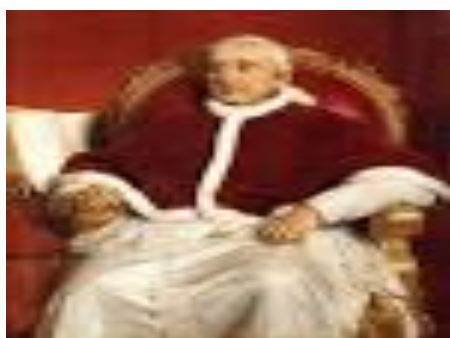
I. Gergely pápa

Gergely napja, eredetileg a diákság ünnepe. A nap ünneplését IV. Gergely pápa rendelte el, ezen a napon emlékeztek I. Gergely pápára, az iskolák patrónusára. Eredete a XVI. századra nyúlik vissza, amikor a tanulók maguk és tanítóik számára adományokat gyűjtöttek. Tulajdonképpen az iskolaév lezárását jelentette, a szeptemberi tanév kezdését csak a XIX. századtól vezették be. Ezen a napon a gyerekek vidám jelmezes felvonulással, köszöntők éneklésével és dramatikus játékokkal emlékeztek Gergely pápára. Bemutatták az iskolai életet. Az új tanulókat iskolába hívogatták, kosarukba pedig adományokat gyűjtöttek.